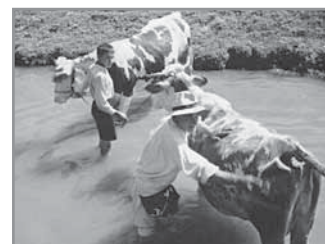
Obr. 9. Hospodářská zvířata ze všech hluckých gruntů byla předmětem nucených rekvizic.

Ceny zemědělských produktů a zboží rostly nadále. V roce 1918 stál 1 kg hovězího masa 14 korun, vepřového 32, vejce 0,44, 1 kg másla 56, sádla 100, 100 kg cukru 160, 100 kg jablek 40. Metr sukna, který se před válkou prodával za 10 korun, stál nyní 140–200 korun. 15 Jak je patrné, úředně stanovené ceny se během války mnohonásobně zvýšily od těch předválečných, ovšem je potřeba si uvědomit, že na černém trhu se obchodovalo v částkách ještě mnohem vyšších.