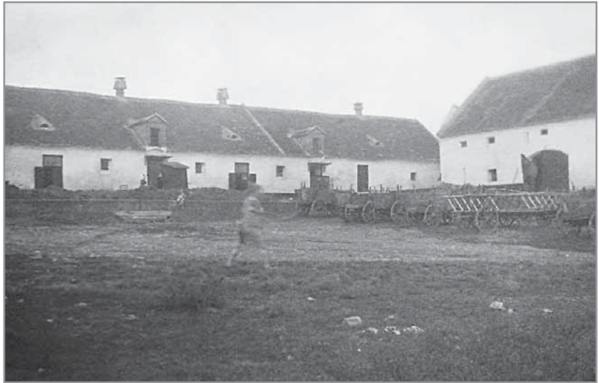
Obr. 10. Vozy na panském (později Penkově) statku. O tohle vše měl za války erár zájem.

z č. p. 341), 17 který si tímto pochopitelně příliš sympatií u místních nezískal. Každý, kdo neodevzdal předepsané množství surovin, musel počítat s domovní prohlídkou. Na živobytí bylo stanoveno přesné množství jednotlivých surovin, které se s postupující bídou neustále snižovalo. Veškeré přebytky se musely odevzdat, nebo byly zabaveny. 18 V roce 1915 bylo například povoleno jen čtvrt metráku obilí na osobu a na měsíc a polovina na dítě do 6 let věku a nějaké obilí na setí. Vše nad tento limit bylo nemilosrdně zabaveno. Za ukrývání potravin hrozily vysoké pokuty: „Komu se obilí podařilo skrýt před rekvizicí, byl na tom dobře. Někteří měli velice pěkné skrýše mezi dvěma stěnami nebo dvěma štíty.“ 19 Ukrývalo se do sněhu, po lesích, kopaly se jámy. Po žních lidé dostávali povolenky k mletí výše zmíněného množství obilí, jehož průběh ve mlýnech úředníci často kontrolovali. Lidé se přizpůsobovali situaci a obilí si doma šrotovali v ručních mlýncích, neboť šrotovačky na jednotlivých gruntech byly zapečetěny. Ceny obilí rychle stouply a v roce 1917 se za 100 kg žita platilo už 600 korun, za réž neboli ozimné žito a za ječmen 500 korun (o rok dříve to bylo za réž a ječmen 120 korun a za pšenici 150 korun). 20