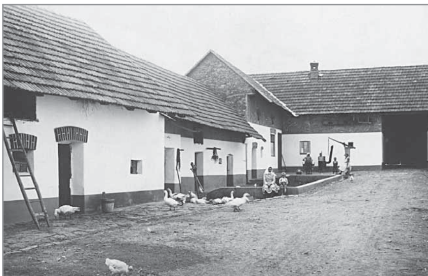
Obr. 8. Všechny hlucké grunty byly těžce postihovány rekvizicemi, přestože většina mužů byla nucena narukovat na frontu.

znamy mrtvých. Zvyšující se počty padlých dávaly tušit, že proklamované několikaměsíční vojenské tažení se konat nebude a že konflikt nabývá oblundných rozměrů. To potvrzovali i očití svědkové, váleční utečenci a deportovaní ranění. Ke strachu o odvedence se postupně přidávaly i obavy o vlastní existenci. Jak se konec války vzdaloval, rostlo všudypřítomné napětí. V tisku se objevovaly první zprávy o popravách za velezradu či dezerci, lidé se dostávali do vězení za častokrát malicherné prohřešky. Moc úřadů, armády a četnictva rostla, život ovládly zákazy, omezení, nařízení. Monarchie a s ní i její obyvatelstvo zabředly do válečné mizérie. Hluk a vůbec obce na Slovácku však do značné míry minul jeden z negativních sociálních fenoménů válečné doby – absolutní česko-německé odcizení a nevraživost mezi oběma zemskými národy. Vhledem k tomu, že Hluk byl fakticky čistě českou obcí, nedošlo mezi místními občany k vlně udavačství a zavlého nepřátelství, jakou poznaly smíšené moravské regiony. I bez toho však předválečná pokojná a příjemná celospolečenská atmosféra nenávratně zmizela. Obyvatelstvo žilo obavami z budoucnosti. Ztráta zaměstnání, finanční problémy, zvýšená kriminalita, zboží mizející z regálů, drahota, kontroly a hlídky, rekvizice, výnosy válečné správy – s tím vším se nyní lidé v zázemí museli vyrovnat.