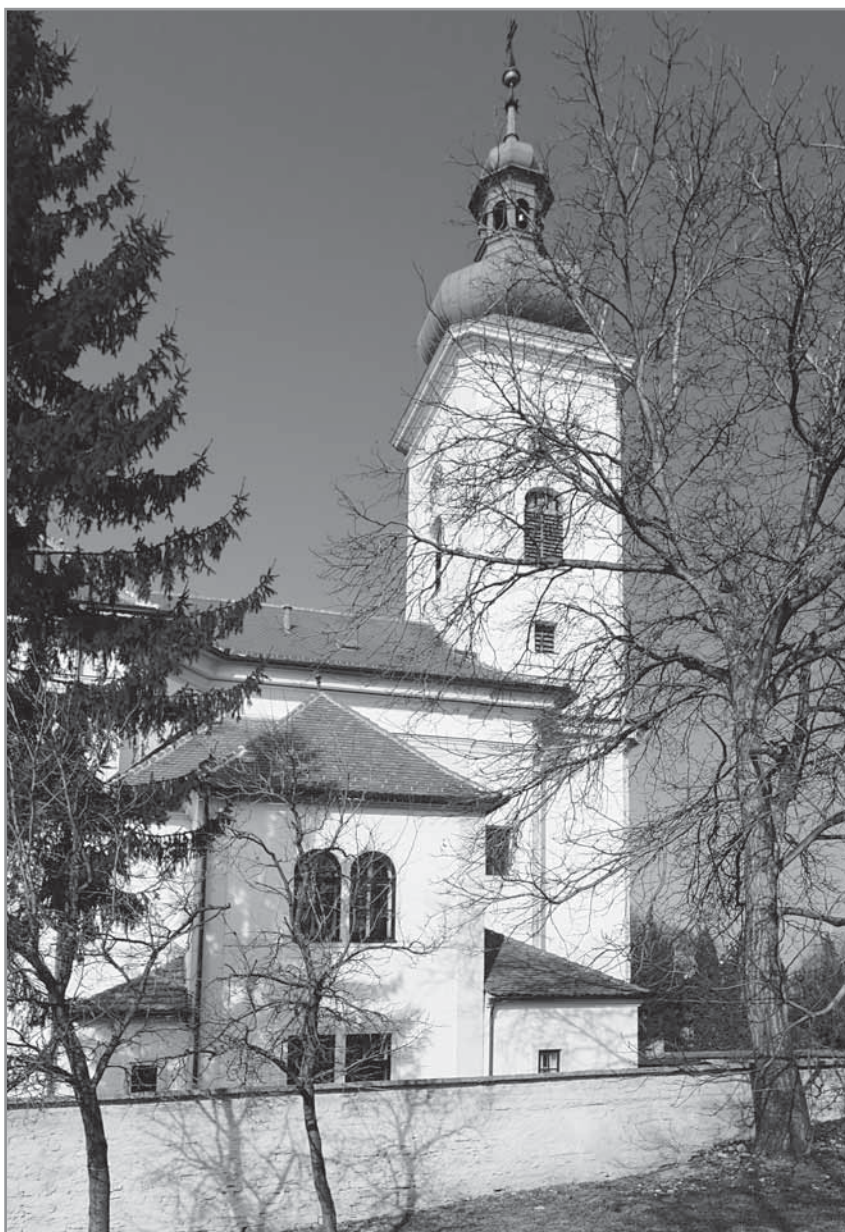
Obr. 11. Také hlucký kostel sv. Vavřince zasáhla armádní potřeba kovů. V letech 1917 a 1918 přišel o oba zvony i varhanní píšťaly, jenom rovněž ohrožené měděné oplechování střechy věže zůstalo zachováno.