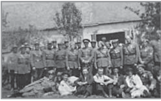
Obr. 6. Skupina legionářů z Hluku a okolí při oslavách 5. června 1938.

voval své mínění nad, takovým bestiálním zabíjením'. 8 Neštěstí jitrila atmosféru o to více, jelikož ve vzájemném konfliktu proti sobě často stáli Češi, jedni ve službách armády, druhí pak coby bezpečnostní složka státu. Vášně čas neotupil a dohru tyto citlivé události měly po válce, kdy vojenští uprchlíci dávali průchod své zlobě vůči místnímu četnictvu. Takto na svou služební povinnost doplatil strážmistr Jančík, kterému shromážděný dav vytloukl okna jeho bytu, a o dva dny později, v noci na 31. října 1918, kdosi hodil do bytu granát. Ten však poničil pouze vnitřní vybavení. Na základě toho se Jančík a krátce po něm i jeho žena, kteří nebyli v době incidentu doma, rozhodli Hluk opustit. Strážmistr Jančík byl převelen do Polešovic a svůj úřad předal strážmistru Rudolfu Blahákovi. Následujícího dne byl v Ouředníčkově hostinci napaden strážmistr Metoděj Král. Kvůli těmto událostem hlucké četnictvo 5. listopadu 1918 opustilo místní úřadovnu a vrátilo se až po 14 dnech po ujištění obecních představených, že vůči nim nebude podnikáno žádných dalších útoků. Hněv vůči střelci, který smrtelně zranil oba dezertéry, dav projevit nemohl. V Hluku již tehdy nepobýval. 9