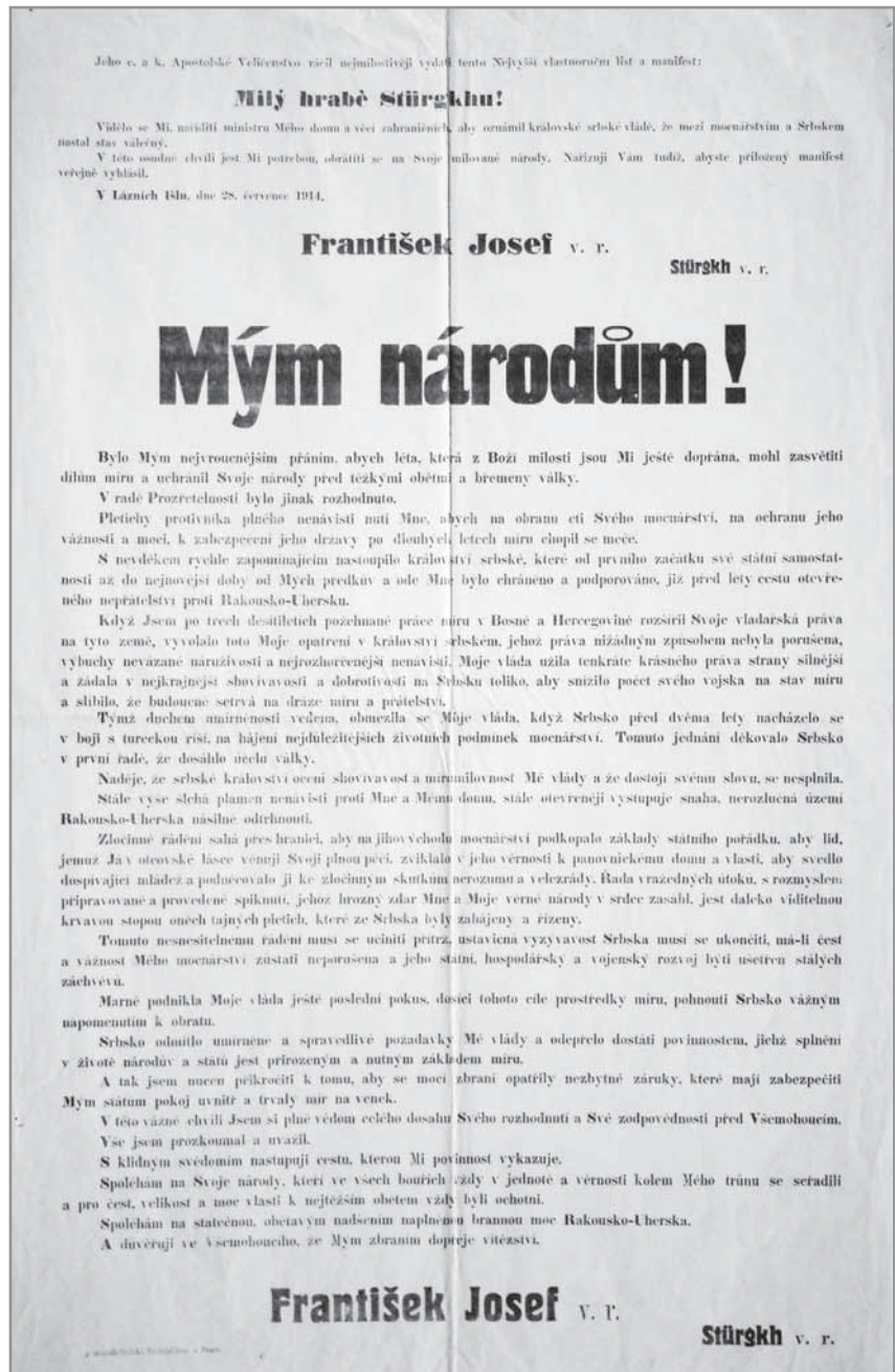
Obr. 1. Příchod válečného konfliktu obyvatelstvu oznamovala vyhláška nadepsaná velkými slovy „Mým národům“.

a povinnost jít bojovat za císaře se týkala stále širšího okruhu osob. Do roku 1918 narukovalo 1240 hluckých mužů ve věku 17 až 45 let. 2 Z nich se domů nevrátilo 65 osob. Padlým byl v roce 1922 na náměstí u schodiště před kostelem vztyčen památník, v jehož základech jsou uloženy zápisy z doby války.