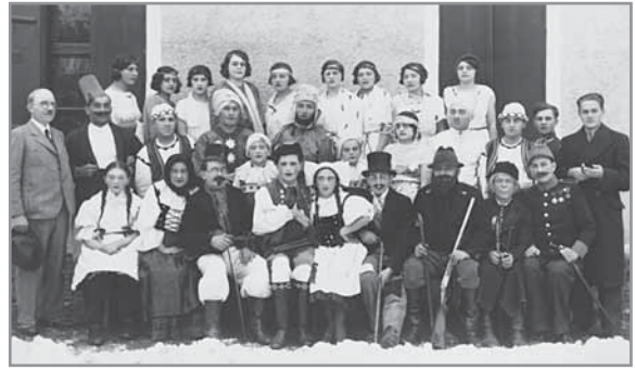
Obr. 58 a, b. Hlučtí ochotníci v roce 1931.

v Hluku k těm kulturním oblastem, které se nemusejí obávat o svou budoucnost.