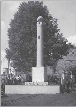
Obr. 3 a, b. Odhalení pomníku padlým v roce 1946.