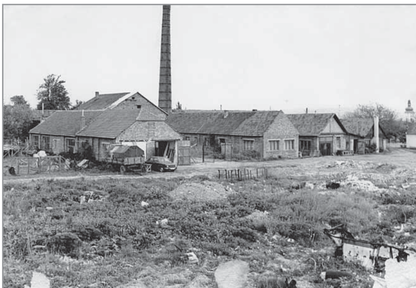
Obr. 14. Areál hlucké cihelny a kolektiv jejich pracovníků.