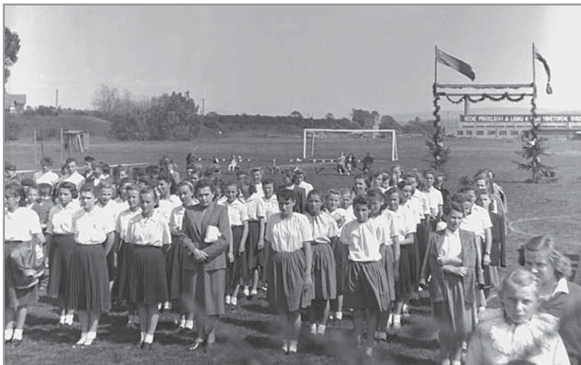
Obr. 8. Hřiště ve Šraňkocích, v pozadí nově vystavené budovy Autopalu.

Poválečná obnova městečka organizovaná samotným národním výborem nemohla dlouhodobě řešit hospodářské a sociální problémy Hluku. Vedle zemědělství, kterým se dosud zabývala většina obyvatel, se jako stěžejní úkol pro budoucí rozvoj začalo jevit zprůmyslnění obce, případně intenzivnější propojení s nedalekým okresním městem Uherským Hradištěm. Kromě pily Františka Bachana, která zaměstná-