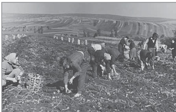
Obr. 20 a, b. Scény z práce hluckých družstevníků.