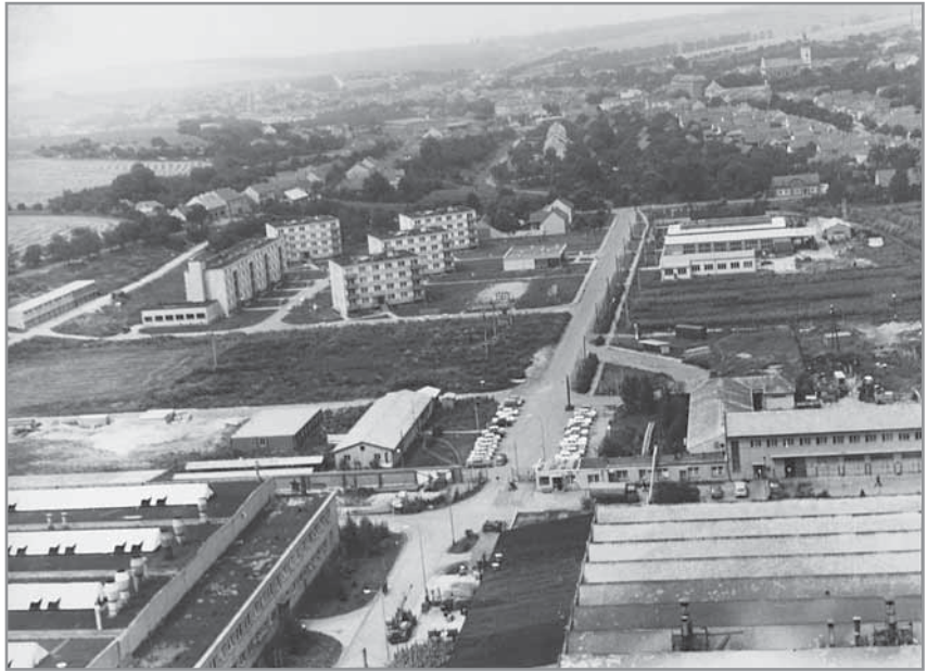
Obr. 37. Pohled na část Hluku z komína Autopalu. Zhruba rok 1975.

skou, zájmovou a kulturní činnost. V 1. poschodí haly se našly prostory pro ubytování 60 lidí a restauraci pro 120 osob, v suterénu sauna a dvoudráhová kuželna. Stavba byla předána veřejnosti 25. listopadu 1984 za účasti předsedy ÚV ČSTV Antonína Himla. Hodnota díla byla téměř 20 milionů korun, místní občané na něm odpracovali 80.000 brigádnických hodin a také místní podniky musely přispět na výstavbu nemalou částkou. První velkou společenskou akcí byla odborná konference Československé revmatologické společnosti ve dnech 31. října až 1. listopadu 1985. Jednou z pravidelných společenských událostí bývaly každoroční tzv. Plesy pracujících.