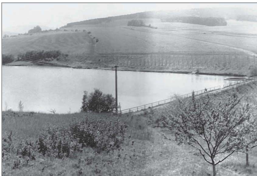
Obr. 22. Přehrada na Byčíně.

1 700 litrů. Špatné výsledky byly vykazovány u drůbeže, jejíž stav se postupně snižoval.