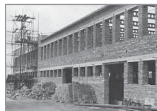
Obr. 36 a, b. Prostor, kde stojí dnes sportovní hala, před bouráním (1973) a rozestavěná budova haly.

slavnostně otevřena v roce 1975 a současně na ní byla umístěna deska na paměť spoluobčanů umučených a padlých za 2. světové války. Dalšími velkými stavbami byla víceúčelová sportovní hala s restaurací a ubytovnou a úprava stadionu s jeho částečným zastřešením. Stavba byla zahájena v první polovině sedmdesátých let 20. století, avšak pro nedostatek finančních prostředků se stavební práce protáhly na více jak deset let. Podoba města se výrazně změnila zbořením celých částí obce nebo alespoň přestavbou domů starších, zasypávaly se staré studny, rozšiřovaly a napřimovaly cesty, které umožnily snadnější příjezd motorových vozidel. Za přispění n. p. Autopal byly v trati Šraňky vybudovány čtyři panelové domy s 36 družstevními a 78 státními byty, v letech 1977–1979 probíhala ve dvou etapách výstavba sídliště rodinných domků na Láně, kde vyrostlo 109 rodinných domů. V roce 1972 také došlo k prvnímu úřednímu pojmenování ulic a veřejných prostranství.