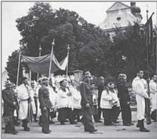
Obr. 29. Náboženské tradice se komunistickému režimu nikdy nepodařilo zcela potlačit. I v Hluku bylo ještě začátkem šedesátých let 20. století Boží tělo velkou slávou.

ží, zejména potraviny. V noci pak Hlukem projíždělo větší množství vojenských vozidel armád Varšavské smlouvy, ale žádné zde ani nezastavilo, obsazeno bylo především Uherské Hradiště, Uherský Brod a další významnější místa. Lidé se dlouho nechtěli smířit s realitou násilné okupace. Na budovách i na silnici se stále objevovaly nové a nové nápisy na podporu zatčených představitelů státu a proti okupantům. Kromě generální stávky 23. srpna od 12. do 13. hodiny se sice lidé neshromažďovali, ale na protest se v obci nekonaly žádné taneční zábavy, filmová představení a sportovní akce, a to až do konce