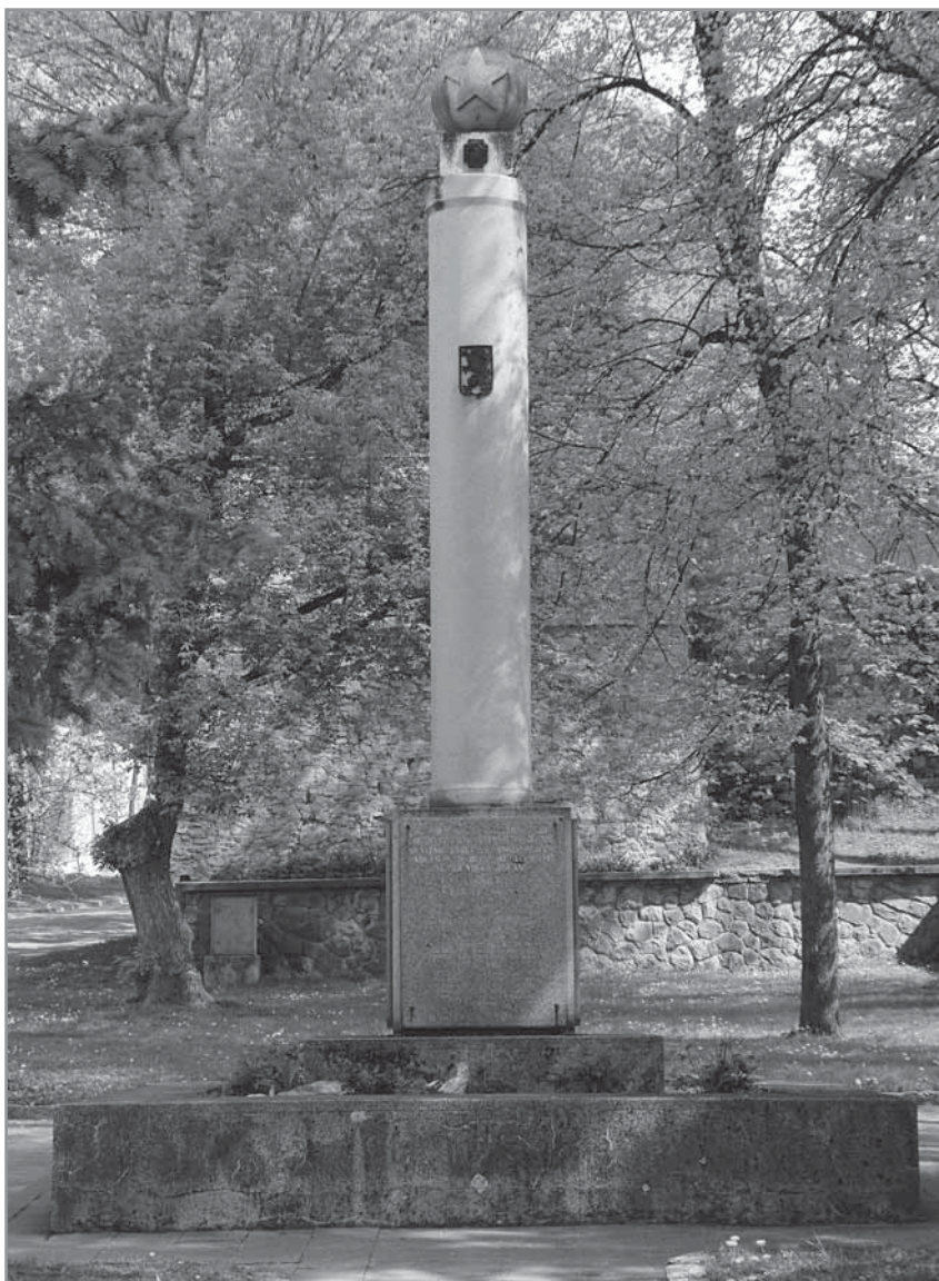
Obr. 2. Pomník padlým rudoarmejcům u kostela sv. Vavřince.

Hlučtí obyvatelé se také pietně postarali o své padlé osvoboditele. Na území Hluku zemřelo 28 sovětských vojáků – v budově měš-