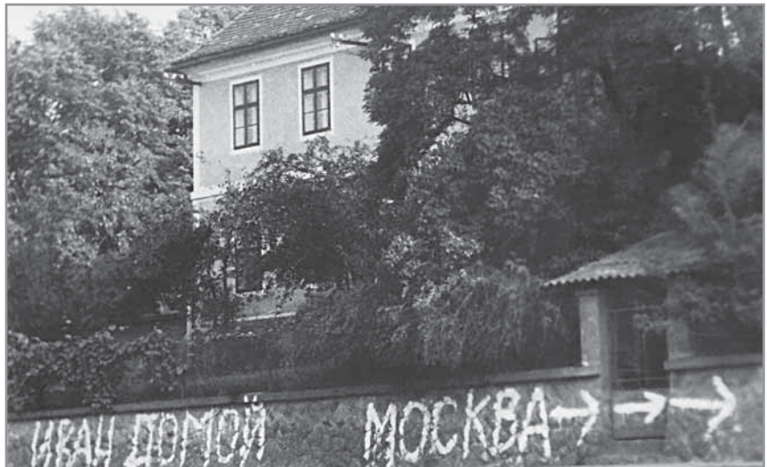
Obr. 30. Nápis Ivani, běžte domů! před hluckou farou, srpen 1968.

ží, zejména potraviny. V noci pak Hlukem projíždělo větší množství vojenských vozidel armád Varšavské smlouvy, ale žádné zde ani nezastavilo, obsazeno bylo především Uherské Hradiště, Uherský Brod a další významnější místa. Lidé se dlouho nechtěli smířit s realitou násilné okupace. Na budovách i na silnici se stále objevovaly nové a nové nápisy na podporu zatčených představitelů státu a proti okupantům. Kromě generální stávky 23. srpna od 12. do 13. hodiny se sice lidé neshromažďovali, ale na protest se v obci nekonaly žádné taneční zábavy, filmová představení a sportovní akce, a to až do konce