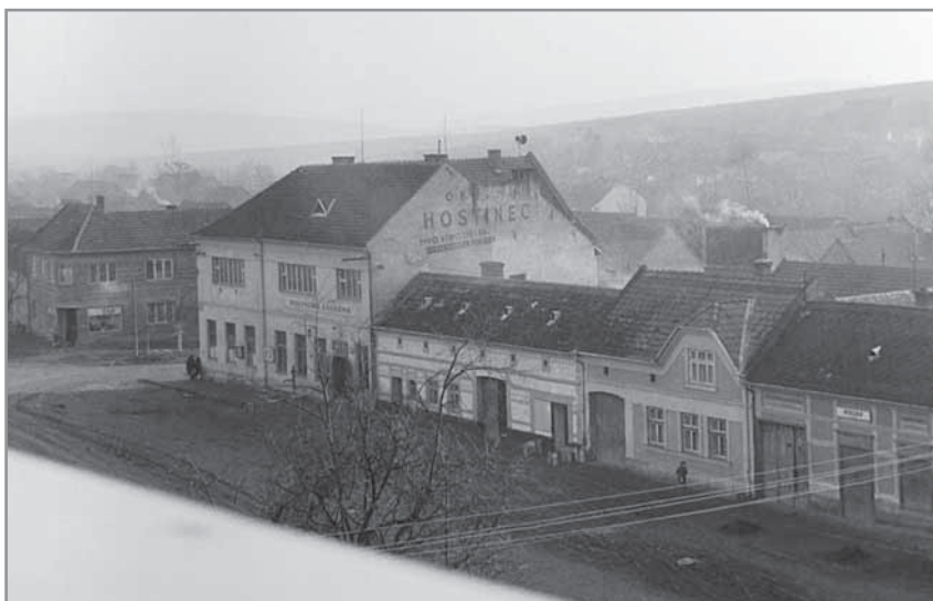
Obr. 5. Horní část náměstí s hospodou, konec čtyřicátých let 20. století.