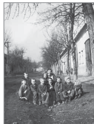
Obr. 40. Lánská ulice na přelomu padesátých a šedesátých let 20. století.