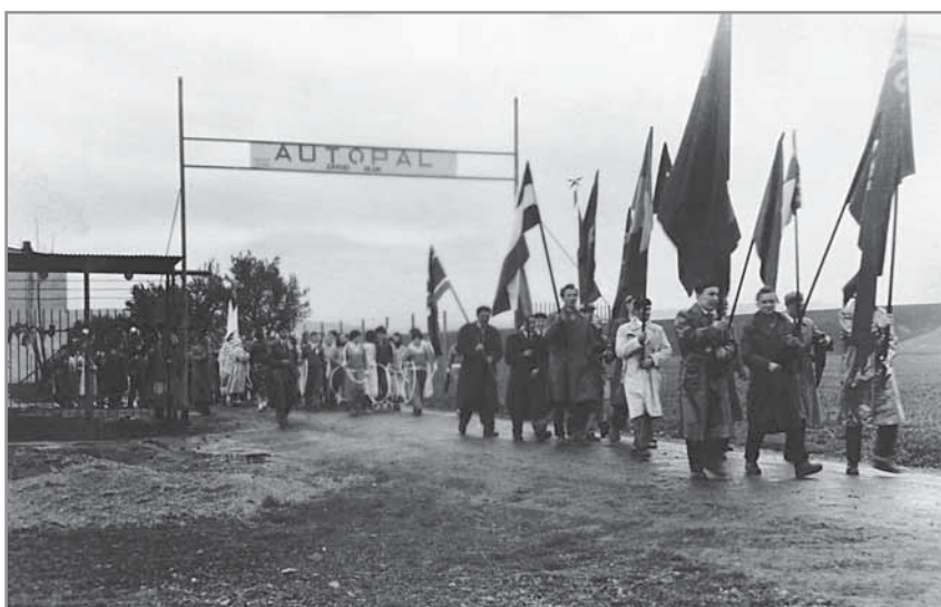
Obr. 27 a, b, c. Podoby 1. máje v Hluku na přelomu padesátých a šedesátých let 20. století.