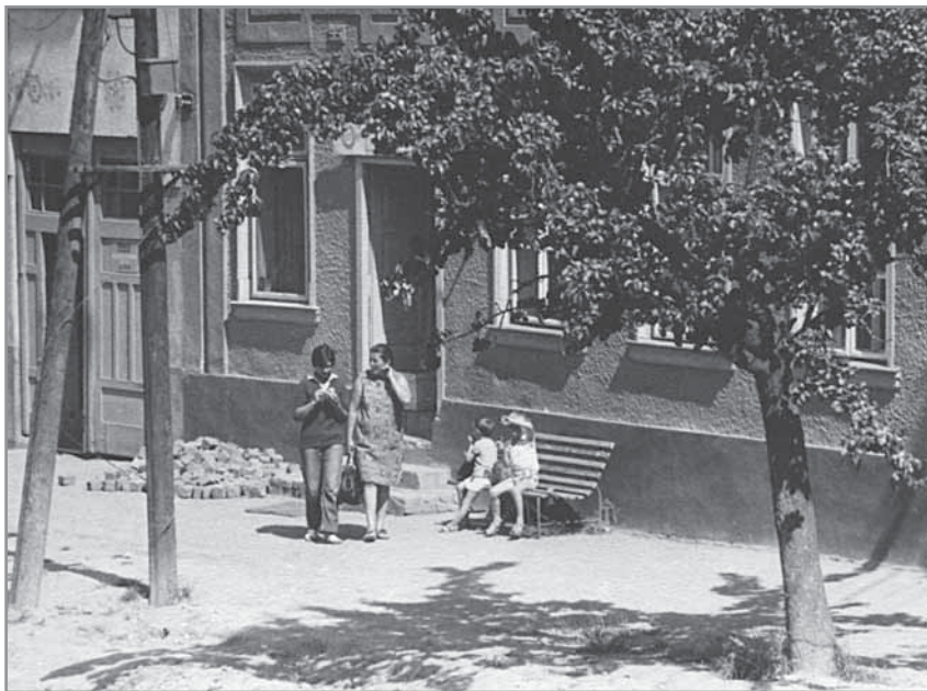
Obr. 17. Cukrárna v domě č. p. 55, asi rok 1967.

V roce 1953 vznikla v Hluku jedna z nejsilnějších spotřebitelských organizací, lidové spotřební družstvo Jednota, které bylo v roce 1960 sloučeno pod okresní organizaci v Uherském Ostrohu. Pod Jednotou například fungovaly malé prodejny obuvi v domě č. p. 145, průmyslového zboží v č. p. 152, cukrárna v domě č. p. 55, oděvy v č. p. 163 a drogerie v č. p. 53 nebo v roce 1962 místní pekárna. Tyto drobné obchody nahradilo pak větší nákupní středisko Jednoty, otevřené 9. května 1978. Národní podnik Pramen pak otevřel novou prodejnu na Dolním konci v č. p. 188 dne 1. prosince 1969 a nákupní středisko vedle fary v roce 1979.