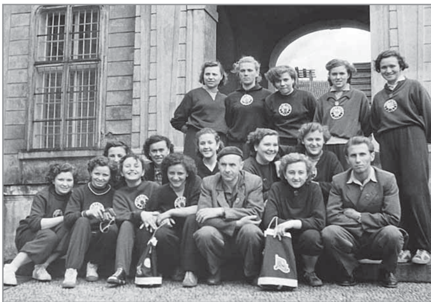
Obr. 45. Účastnice první celostátní spartakiády v Praze v červenci 1955.