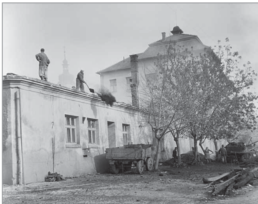
Obr. 62. Až do požáru v roce 1954 sídlila hlucká knihovna v objektu Penkova dvora.

Původní Lidový dům se po roce 1949 změnil na Dům mládeže a středisko Čs. svazu mládeže a v roce 1953 se z něj stal Kulturní dům, který do své správy převzal Závodní klub ROH n. p. Autopal. Po desetiletí se v něm konávaly veškeré kulturní akce, ale působil zde i závodní hudební kroužek, kroužek národopisný, divadelní, výtvarný či leteckého modelářství. V roce 1958 začal závodní klub budovat rekreační středisko po Babímí horami. Početné subjekty, které zpočátku vytvářely kulturu v obci (Osvětová beseda národního výboru a závodní kluby místních podniků), byly dne 4. prosince 1965 sloučeny do Sdruženého závodního klubu pracujících v Hluku. Pod SZK, umístěný v pronájmu obce na opravené tvrzi a v bývalém Lidovém domě, patřily nyní tři dechovky, taneční orchestr, divadelní a slovácký kroužek, výbor pro Dolňácké slavnosti a další zájmové kroužky.