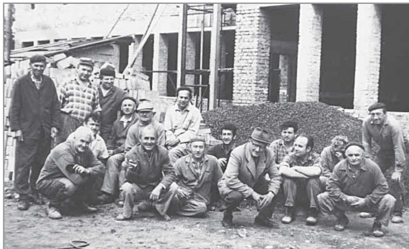
Obr. 41. Stavba školky v Zelnicích v akci „Z“.