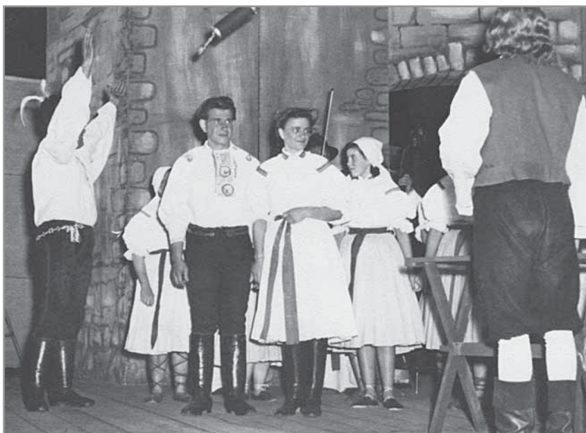
Obr. 59. Představení Hejtman Šarovec v roce 1957.