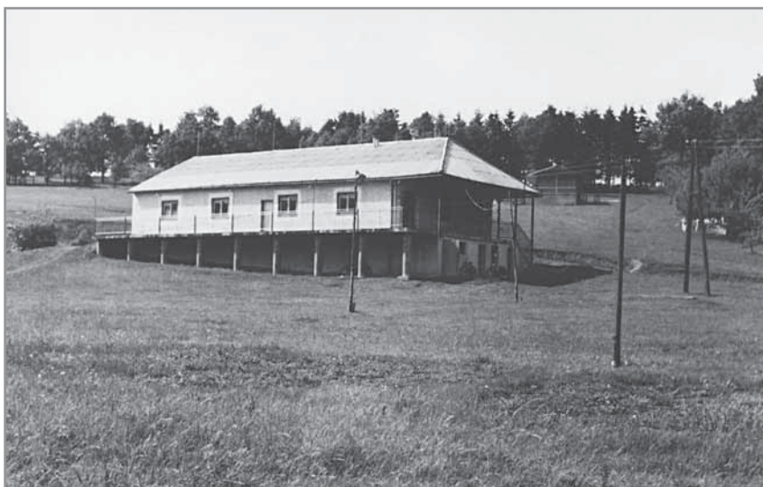
Obr. 9. Palácká chata na Babí hoře.

francouzské firmy „SOFUCO“. Byla to výroba chladičů pro Škodu Mladá Boleslav. 3 Závod zabezpečoval pro své zaměstnance i sociální požitky. Pod Babí horou vybudoval rekreační středisko, z něhož vznikl v roce 1967 pionýrský tábor. Chatový tábor byl v polovině sedmdesátých let rozšířen a upraven tak, aby do něj mohly přijíždět děti i ze Sovětského svazu, Německé demokratické republiky a Polska. Zdejší závod měl totiž družební styky například s podnikem Karburátor v Leningradě, se slovenskou Nemšovou atd. Po roce 1970 začali v závodě v rámci Rady vzájemné hospodářská pomoci mezi socialistickými státy pracovat dělníci z Vietnamu. Samozřejmostí byl závodní lékař, mikrojesle a další zařízení sociálního typu. Na druhé straně v závodě už v roce 1952 vznikly oddíly Lidových milicí, které zejména po potlačení Pražského jara v letech 1968–1969 měly dbát na udržení pořádku a klidný průběh začínající normalizace.