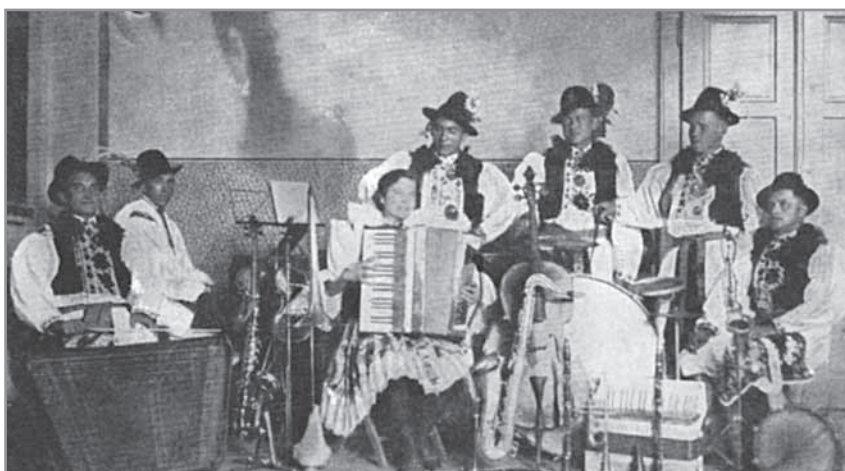
Obr. 53. Hlučtí muzikanti v Praze. Březen 1938.