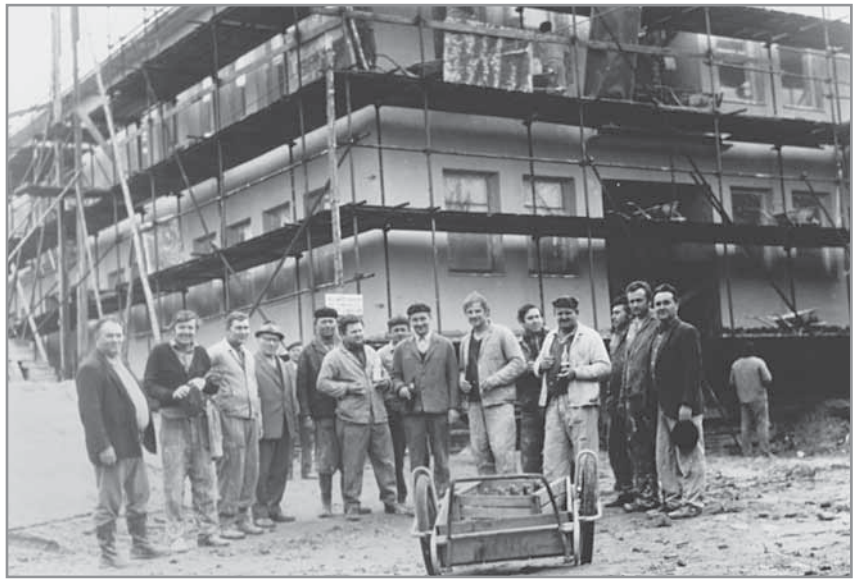
Obr. 35 a, b. Akce „Z“ – stavba nové pošty (před 1975) a bourání staré hasičské zbrojnice (1976).