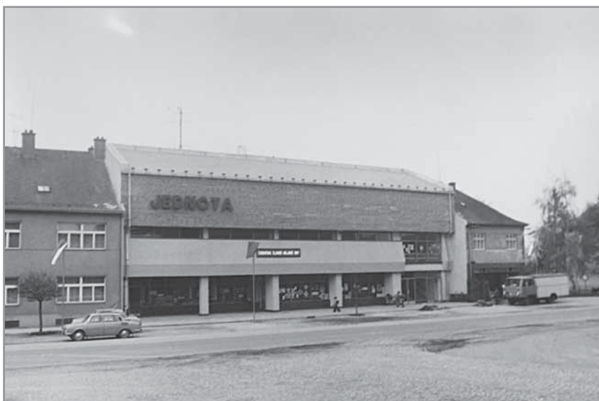
Obr. 39. Obchodní středisko JEDNOTA.