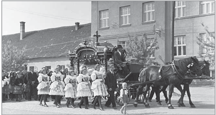
Obr. 42. Pohřební vůz tažený koňmi sloužil do roku 1976.

Zlepšení materiálních podmínek bylo doprovázeno velkými změnami v oblasti společenské a sociální. Brzy po roce 1948 byla zahájena silná marxistická propagace spojená s protináboženským bojem. K tomu měly sloužit i nové formy veřejného občanského života, jako bylo vítání občánků, předávání občanských průkazů, občanské pohřby atd. Zejména zákonem v roce 1950 nařízené občanské sňatky byly přijímány velmi negativně, i když postupem času plně převládly nad opakovanými církevními. V obřadní síni na tvrzi se odbývaly také oslavy významných jubileí a další společenské akce. Civilnímu způsobu rozloučení se zesnulými měla sloužit výstavba smuteční sítě, rea-