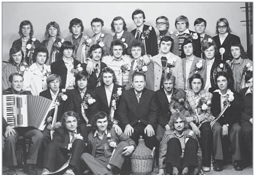
Obr. 43. Hlučtí odvedenci z ročníku 1958.

Zlepšení materiálních podmínek bylo doprovázeno velkými změnami v oblasti společenské a sociální. Brzy po roce 1948 byla zahájena silná marxistická propagace spojená s protináboženským bojem. K tomu měly sloužit i nové formy veřejného občanského života, jako bylo vítání občánků, předávání občanských průkazů, občanské pohřby atd. Zejména zákonem v roce 1950 nařízené občanské sňatky byly přijímány velmi negativně, i když postupem času plně převládly nad opakovanými církevními. V obřadní síni na tvrzi se odbývaly také oslavy významných jubileí a další společenské akce. Civilnímu způsobu rozloučení se zesnulými měla sloužit výstavba smuteční sítě, rea-