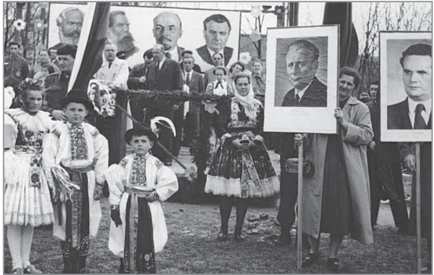
Obr. 28. Schizofrenii doby nejen v Hluku vyjadřuje prolínání lidových tradic a atributů komunistických manifestací.