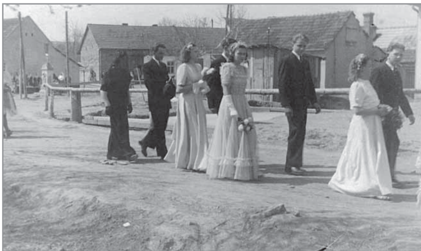
Obr. 3 c. Ještě v roce 1947 se chodilo po provizorním dřevěném mostě.

Přes zřetelně příznivou poválečnou hospodářskou obnovu státu a zlepšující se sociální podmínky obyvatel se začaly brzy projevovat rozpory v názorech na budoucí vývoj země mezi komunisty a jejich spojenci v socialistických stranách na jedné straně a zastánci tradiční