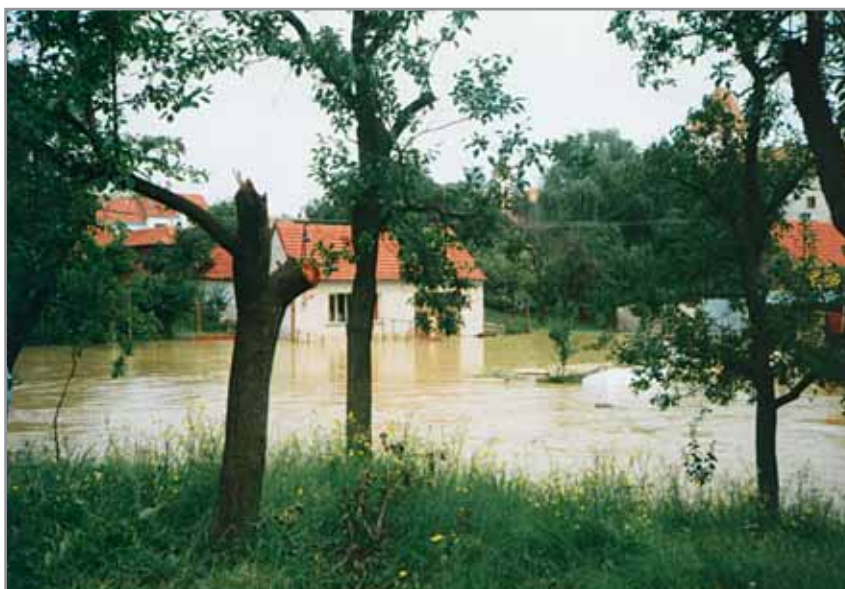
Obr. 65. Povodeň v Hluku v roce 1997. Pohled za tvrz.