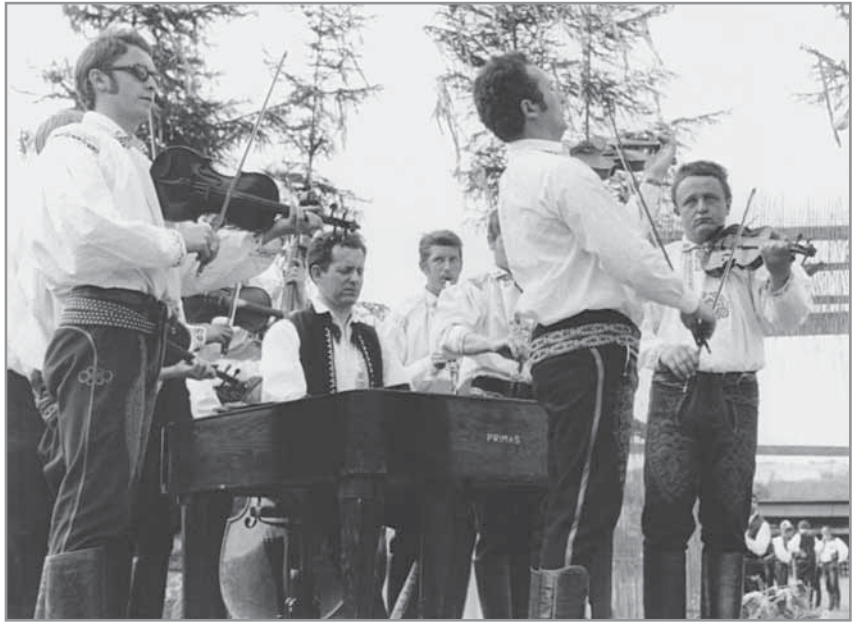
Obr. 56. Cimbálová muzika Dolňácko.