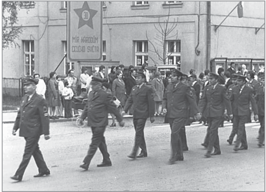
Obr. 32. Typickým reprezentantem normalizační doby byly Lidové milice.