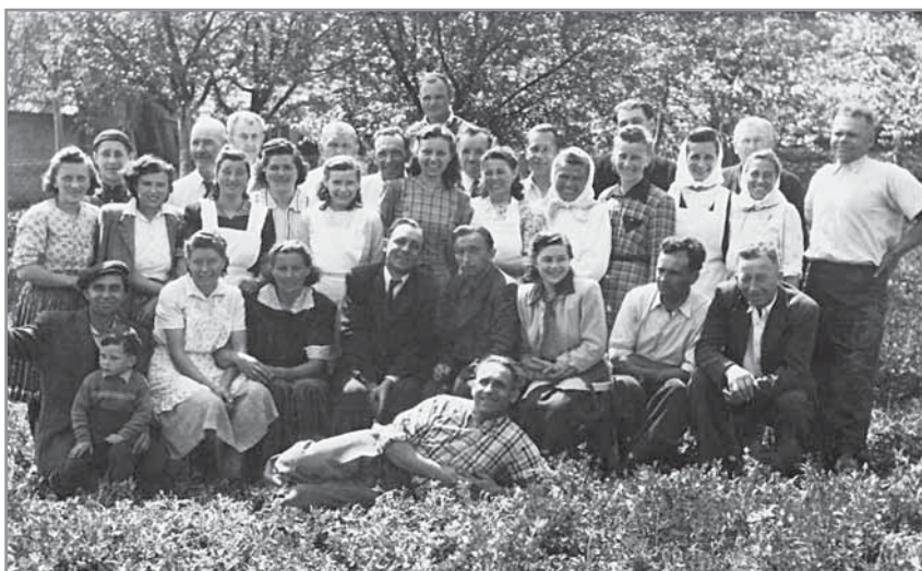
Obr. 11. Kolektivní fotografie „Svedrupáků“.