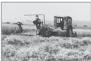
Obr. 18. Sekačka - lopafák.