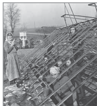
Obr. 47 a, b. Školní zahrada po i před zprovozněním.

korun. Epidemie žloutenky v roce 1964 si také vynutila generální opravu toalet na obou školách. V roce 1969 byla zahájena výstavba učitelských bytů. Tato výstavba měla řešit především vysoké procento dojíždění učitelů do Hluku a tím jejich malou angažovanost ve prospěch veřejného života v obci. Z 28 členů učitelského sboru tehdy dojíždělo 10 ze vzdálenějšího okolí, většinou z Uherského Hradiště.