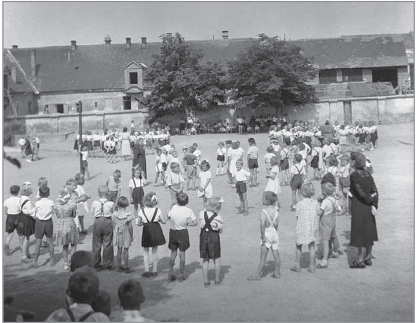
Obr. 48. O přestávce na školním dvoře.

1945, se přihlásily i děti rodičů, které po léta kostel nenavštěvovali. Normalizační léta se proto ve škole opět zaměřovala na ateistickou výchovu, ve školním roce 1972–1973 chodilo do náboženství už jen 30 % dětí a počet přihlášených v důsledku nejrůznějšího zastrašování brzy klesl pod 10 %. Výchova nesená v duchu tzv. socialistického vlastenectví a proletářského internacionalismu vedla k obnově pionýrské organizace včetně zapojení dětí 1. až 3. ročníku do tzv. jiskřiček. Škola vedle tradičních výletů pořádala zájezdy do divadel, především do Slovákého divadla v Uherském Hradišti a Janáčkovy opery v Brně, na výchovné koncerty, filmová představení a besídky. Znovu bylo obnoveno dopisování s družebními školami v Sovětském svazu, k němuž přibyla družba s dětmi v Německé demokratické republice a na Slovensku v Nemšové. Mezi nepovinnými předměty se na škole objevily pohybové hry, sborový zpěv a technická praktika, ze zájmové činnosti našla odezvu především taneční a dopravní výchova. Škola dostala k dispozici také rekreační zařízení n. p. Autopal Hluk na Babí hoře, kde se konávala letní škola, a chatu n. p. Sloko Uherské Hradiště na Lopeníku, kde probíhal zimní lyžařský výcvik. Starší žáci hlucké školy dosáhli v roce 1977 významného sportovního úspěchu, když zvítězili ve své kategorii v IX. ročníku Poháru československého rozhlasu v lehké atletice. 5