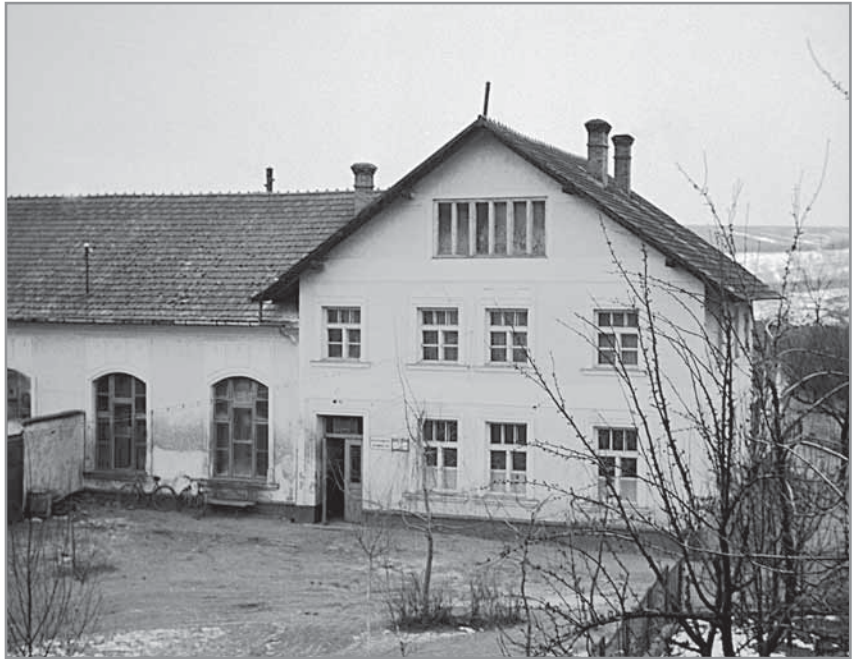
Obr. 63. Hronkovo, později Lidový dům.