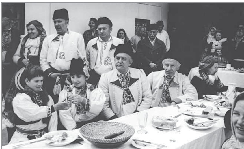
Obr. 52. Z natáčení slavného seriálu na motivy knih Zdeňka Galušky Slovácko sa nesúdí .