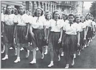
Obr. 4 a, b. Sokolský slet v Praze 1948 byl velkou protikomunistickou manifestací. Účastnili se jej rovněž sokolky z Hluku.