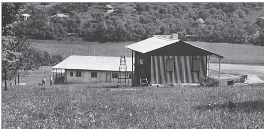
Obr. 49. Tábor na Babí hoře.

Nástup žen z domácností do průmyslové a zemědělské výroby vedl také ke změnám ve výchově dětí předškolního věku. V roce 1948 byl v obci zřízen dětský útulek, fungující zpočátku pod Okresní péčí o mládež. Od září 1951 se útulek změnil na mateřskou školu, která se přestěhovala do prostor staré školy. V té době ji navštěvovalo asi šedesát dětí, jejichž počet se pomalu, ale pravidelně zvyšoval. Ve školním roce 1961/1962 se přihlásilo již 93 dětí, přitom všechny žádosti nemohly být uspokojeny, i když se školka rozšířila na dvě třídy.