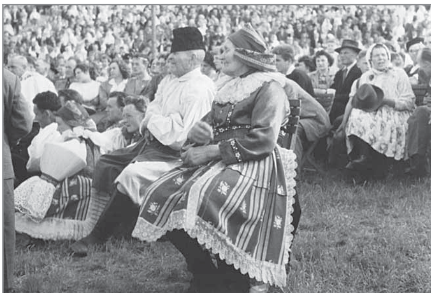
Obř. 50. Dolňácké slavnosti v Hluku v roce 1959.

Nadšení lidovou kulturou, ale i prvky regionálního vlastenectví mísící se s nacionálním romantismem vedly zástupce několika místních organizací, učitelů a dalších nadšenců, aby při příležitosti 20. výročí vzniku republiky uspořádali v Hluku 5. června 1938 velké národopisné slavnosti. Touto akcí měla být založena nová tradice oslav Dolňácka, ale demonstrovala i odpor proti fašismu a snahu o zachování národní svébytnosti. Následný rozpad Československa a německá okupace proto přinesly pro všechny velké zklamání. Obava, zmatek a rozporuplnost v pohledu na budoucnost českého národa zavládly v hlavách většiny lidí. Jedním ze slepých východisek z této situace bylo i založení hnutí Národopisná Morava, jejíž členové propagovali myšlenku připojení jihovýchodní Moravy ke klerofašistickému Slovensku. Tato diskreditace národopisných snah poškodila Hluk natolik, že obnova slavností po 2. světové válce trvala řadu let, a to právě v době, kdy tzv. socializace vesnice přinášela rozpad tradičních hodnot do všech oblastí života venkovského obyvatelstva.