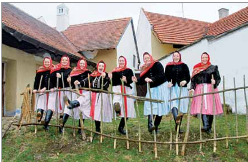
Obr. 57. Ženský sbor Klebetnice.