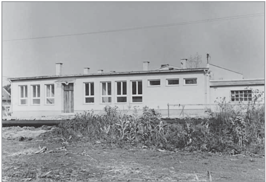
Obr. 13. Podoba budovy družstva Obzor v roce 1969.