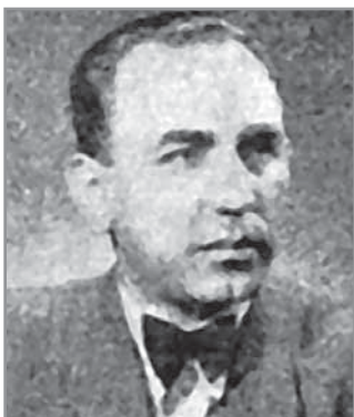
Obr. 13. Spisovatel František Omelka.