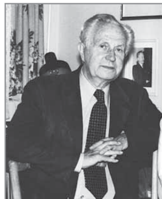
Obr. 10. Spisovatel František Kožík.