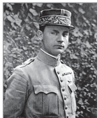
Obr. 19. Milan Rastislav Štefánik.