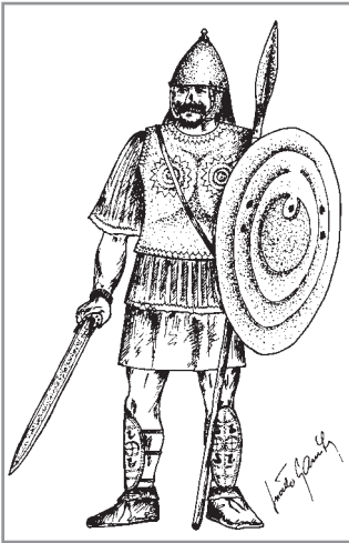
Obr. 7. Pokus o kresebnou rekonstrukci bojovníka z mladší doby bronzové. Námět a kresba Luděk Galuška.

Dnes je doba bronzová členěna na čtyři úseky, z nichž každý odpovídá jinému kulturnímu komplexu a poněkud jinému stupni společenského vývoje. Úvodních asi pět století starší doby bronzové je zjednodušeně řečeno dobou civilizačního rozvoje. Nárůst je také patrný v počtu obyvatel. Předpokládá se, že vesnice kolem roku 1700 před Kristem mohly čítat v průměru kolem sta obyvatel. V následujícím století se hustota zalidnění ještě zvýšila.