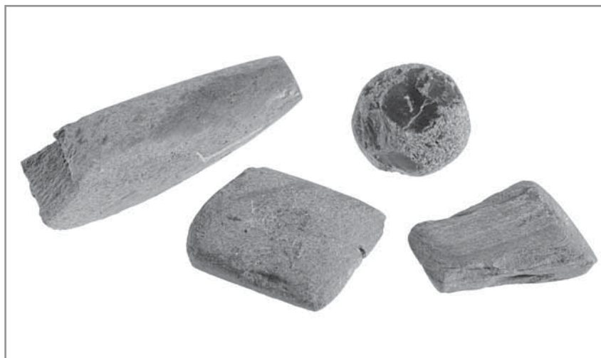
Obr. 5. Soubor tří kusů poškozené kamenné broušené industrie – klínů a úštěp rohovce, Hluk, neolit, 5.–4. tisíciletí před Kristem.