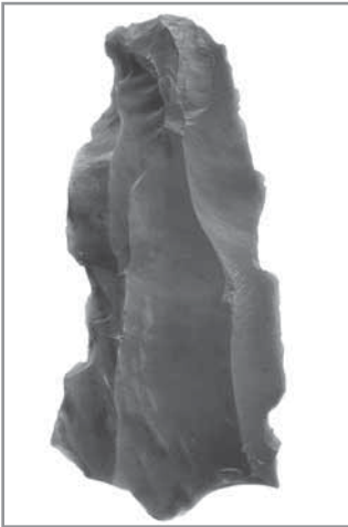
Obr. 3. Škrabadlo z rohovce, Hluk, neolit, 5.-4. tisíciletí před Kristem.