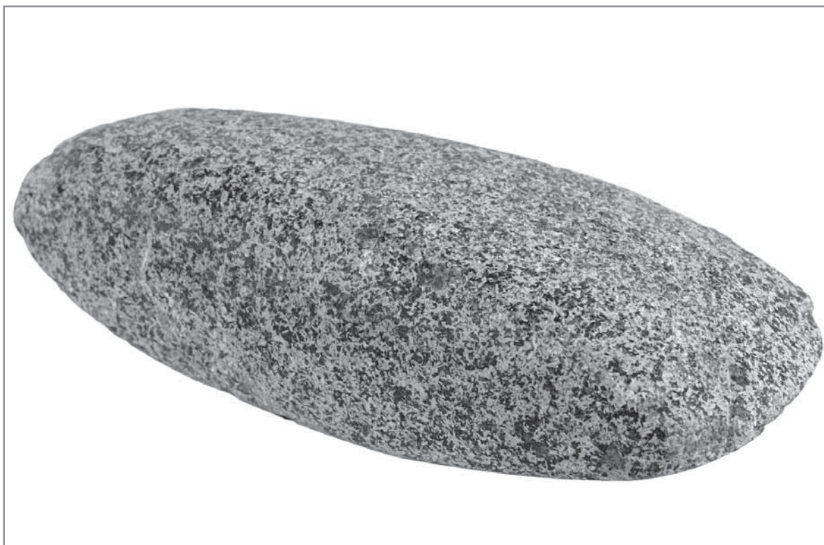
Obr. 6. Silicitová sekerka, Hluk „Pod Babí Horou“, eneolit, konec 3. tisíciletí před Kristem.

byla doba příznivá dalšímu rozvoji zemědělství i růstu populace, která pronikla mimo dosud obydlená místa. Vlivem intenzivní činnosti člověka ubylo lesních porostů, které ustoupily zemědělsky obdělávané půdě. Ostatně důležitá změna se udála i v zemědělství. Původní obdělávání půdy prostřednictvím primitivních kopáčů nahradilo první jednoduché rádllo tažené dobyt看em. Velkou roli sehrávalo také pastevectví.