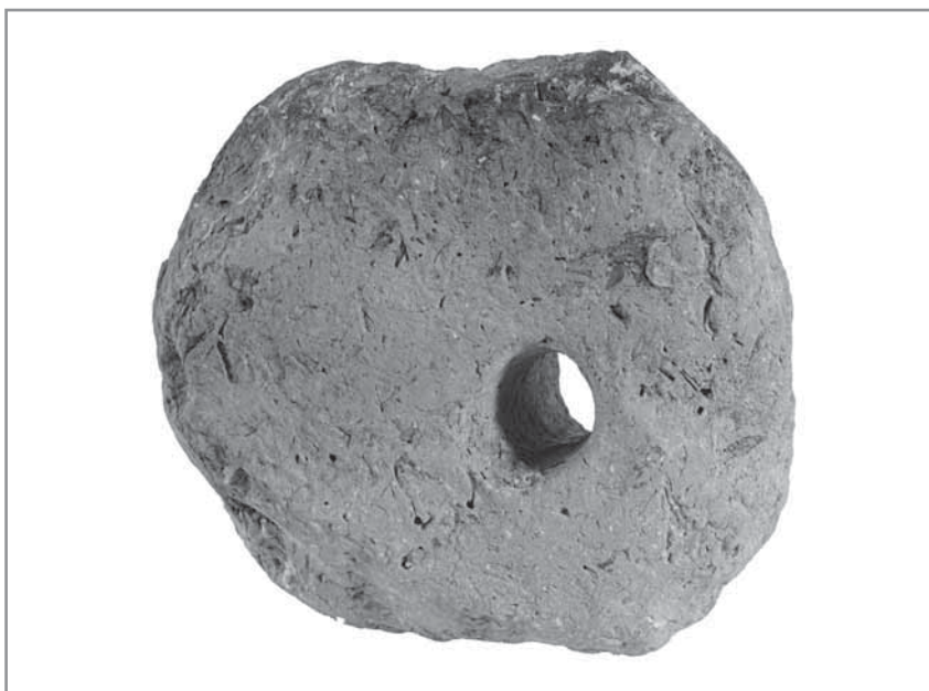
Obř. 8 a, b. Keramická závaží stavu, Hluk „Paligr“, mladší až pozdní doba bronzová, 1 200–800 před Kristem.