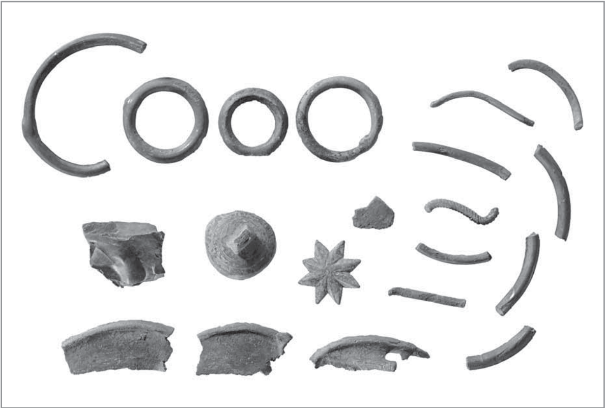
Obr. 9. Depot zlomků bronzových předmětů s úštěpem radiolaritu, Hluk pod „Hlubočkem“, mladší až pozdní doba bronzová, 1 200–800 před Kristem.

Je nepochybné, že koncentrace většího množství depotů poukazuje na větší bohatství společnosti.