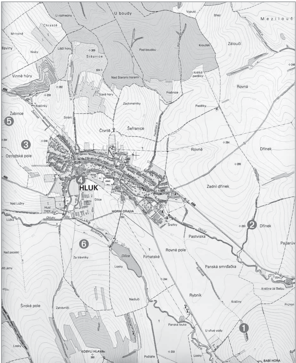
Obr. 1. Katastr města Hluk s vyznačení pravěkých nálezů.

Hlavní archeologická naleziště v Hluku: 1. Babí hora, 2. Dřínky, 3. Ostrožské Pole, 4. Paligr, 5. Zadní Žabinec, 6. Za Trávníky Pravěká období – legenda: N – neolit, E – eneolit, B – doba bronzová, H – halštát, doba železná, K – Keltové, G – Germáni 1. N, E, K; 2. E, G; 3. N; 4. N. E. B. H. L. G; 5. E; 6. N