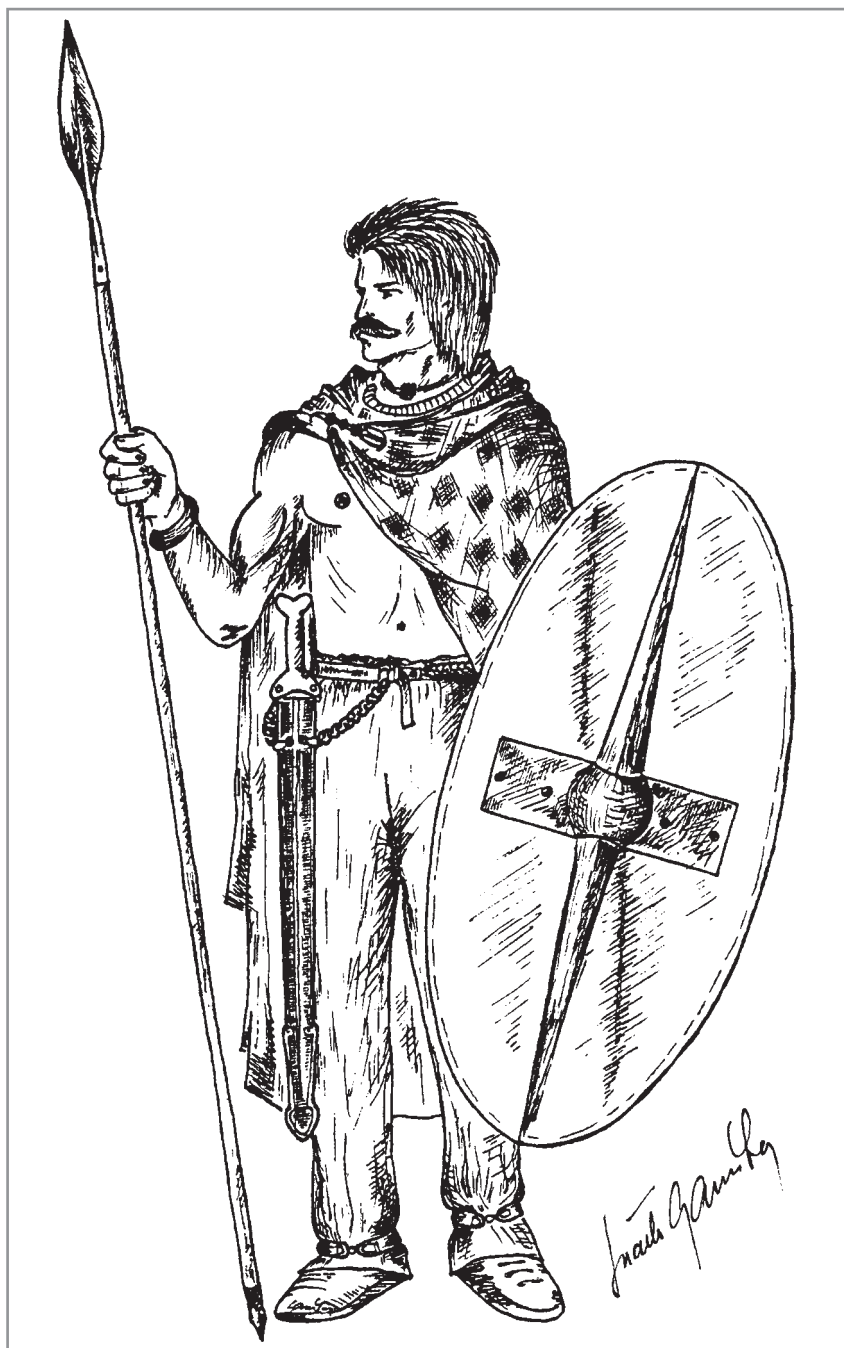
Obr. 10. Pokus o kresebnou rekonstrukci keltského bojovníka. Námět a kresba Luděk Galuška.

jejich domovem. Germáni ovládali rozsáhlá území severní a střední Evropy, na západě ohraničené řekou Rýn a na jihu Dunajem. Na obou těchto hranicích se střetávali s expanzí Římské říše v souvislosti s dobýváním nových provincií ve středoevropském prostoru. Proti