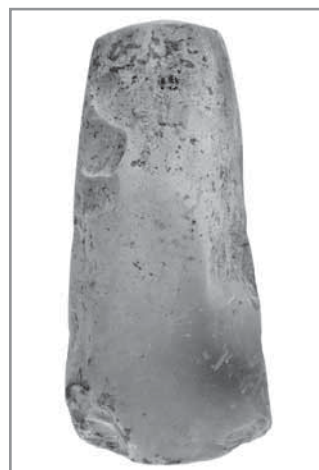
Obr. 4. Kopytovitý klín z amfibolové břidlice, Hluk „Na Kroužku“, neolit, 5.–4. tisíciletí před Kristem.

Jiná surovina byla používána pro výrobu broušených a vrtaných nástrojů. Často se vyráběly z břidlic, které ve větším množství najdeme v údolí řeky Svratky, v oblasti jihozápadní Moravy, v pohoří Hrubého Jeseníku a jinde.