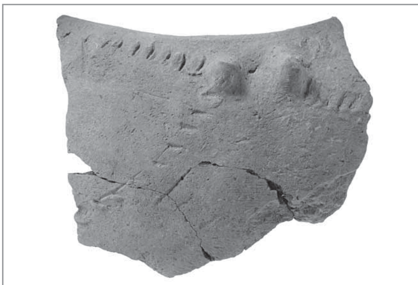
Obr. 2. Stěp z nádoby kultury s lineární keramikou zdobený plastickými výčnělky a tzv. „nehtovými vrypy“, Hluk „Paligr“, konec 6. tisíciletí před Kristem.

stvo rozšířilo přes Balkán a Karpatskou kotlinu až do střední Evropy. V průběhu 6. tisíciletí před Kristem byla kultura posledních paleolitických lovců a sběračů vystřídána zemědělskou civilizací mladší doby kamenné. Nastala nová epocha pravěkého vývoje, doba na přírodě již ne tak závislého života.