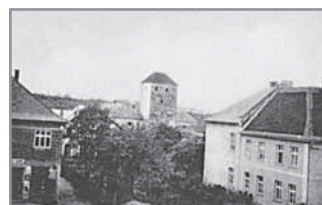
Obr. 20 a, b. Hlucké náměstí směrem k tvrzi a směrem ke kostelu.