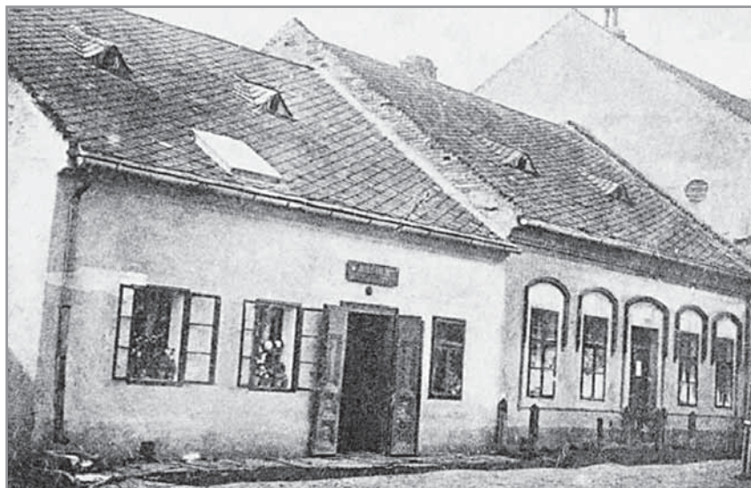
Obr. 18. Svadbíkův hostinec.