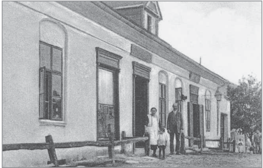
Obr. 16. Hospoda rodiny Ouředníčků, později Šumpolcova.

V letech 1914–1923 byl znovu pronajímán veřejnou dražbou, avšak následně v letech 1923–1931 uzavřen, protože zde musely být umístěny dvě učebny místní školy. Teprve roku 1931 začal obecní hostinec opět sloužit svému účelu. Jeho novým nájemcem se stal rolnický pivovar z Uherského Ostrohu, takže můžeme s jistotou říci, že se zde čepovalo výhradně ostrožské pivo. Nový hostinec měl taneční sál, který byl využíván i pro divadelní představení, jeho kapacita byla 150 sedadel.