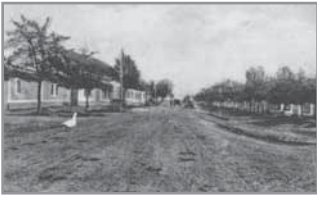
Obr. 4. Hluk na svém dolním konci, vpravo odbočka do Klebetova.

veřejností napadání. Četnická stanice byla v Hluku umístěna postupně v domech č. p. 135, 152, 186, 164 a 230. 3