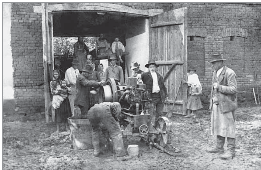
Obr. 10. Práce u mlátičky obilí, 1915.