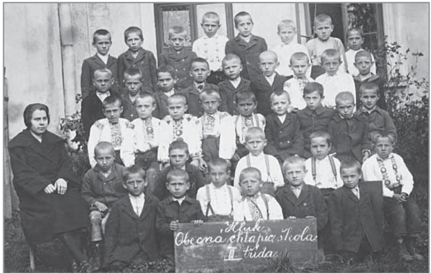
Obr. 23. Hlucké děti před starou školou.

pis, dějepis, přírodopis, přírodopyt, tělocvik a ruční práce, školní docházka se prodloužila do 14 let věku dítěte, nově bylo uzákoněno vedení třídních katalogů a školních kronik. Samotnými reformami se však nepodařilo odstranit materiální problémy hlucké školy. Přeplněných tříd se při své návštěvě v zimě roku 1874 zhroutil uherskohradištský okresní hejtman Bedřich Radnický, který se také zasadil o urychlené rozšíření školy. Dne 2. června 1874 se začalo se stavbou západního křídla, které mělo obsahovat další velkou třídu, kompletní byt pro řídicího učitele a pokoj pro jednoho učitele. Stavba školy byla vedena ve vlastní režii obce, na stavbu pak dohlíželi mlynář Vilém Pipal jako předseda místní školní rady a starosta obce Matouš Dohnal. Plány školy zhotovil ing. František Jeřábek z Uherského Hradiště, část materiálu na přímělu správcem dvora Josefa Rause daroval uherskoostrožský velkostatek. Za tuto významnou pomoc byl Josef Raus jmenován prvním hluckým čestným občanem. Celková cena přístavby a opravy dosavadní části dosáhla 9 000 zlatých, z nichž 3 000 zlatých si obec půjčila od Zemské pokladny v Brně. Po slavnostním otevření školy 5. května 1875 mohl tehdejší řídicí učitel Emil Zapletal s hrdoostí napsat do školní kroniky: „Školní budova je krásná a nádherná a budí pozornost každého mimojducího. Dejž Bůh, aby tato budova dlouhá léta stála a z ní vycházející mládež k hodným, statečným a bohabojným občanům vzrostla!“.