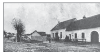
Obř. 15. Hlucká obecní hospoda.