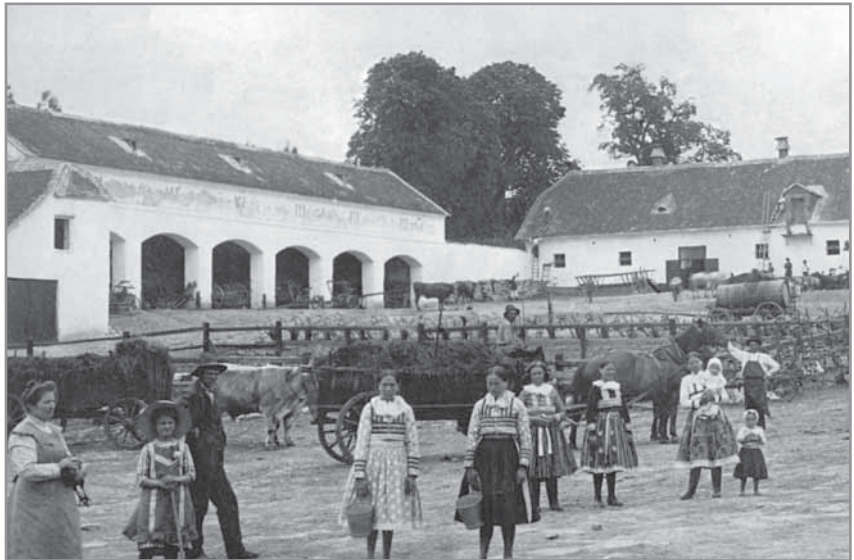
Obr. 11 a, b. Práce na vrchnostenském statku v úvodu 20. století.

nutil rolníky, aby využívali ladem ležících polí k sázení okopanin a setí píce. Jeteloviny a okopaniny rozšiřovaly a zkvalitňovaly krmivovou základnu a vytvářely podmínky pro rozšíření chovu dobytka. Rozvoj dobytkařství podporovala i rakouská vláda, když už v roce 1813 nařídila udělovat medaile hospodářům, kteří se vyznamenali v chovu hovězího dobytka, a už předtím odstranila desátek z píce, vypěstovaných na úhorech. Křížením domácího chovu a švýcarských býků vzniká nový typ červenostrakatého dobytka, zvaný červený slovácký. Změny v chovu dokládá i statistika hluckého chovu dobytka.