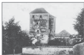
Obr. 21. Hlucá tvrz na přelomu 19. a 20. století.

řemeslníků a živnostníků (18 %). Dělníků a nádeníků uvádí František Hořínek 24 %. Malé procento bylo místní inteligence, k níž kromě kněží a učitelů patřil především obvodní lékař a zvěrolékař. Ještě v 19. století postihly Hluk dvě velké epidemie cholery, v roce 1831 během šesti týdnů zemřelo šedesát dospělých osob a v roce 1836 za stejnou dobu dokonce 280. K špatné zdravotní situaci obyvatel přispívalo nejen nedodržování základních hygienických návyků, ale také rozšířené užívání pálenky, a to i u docela malých dětí.