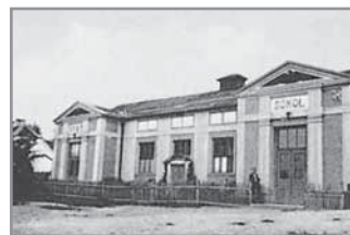
Obr. 19. Budova hlucké Sokolovny.