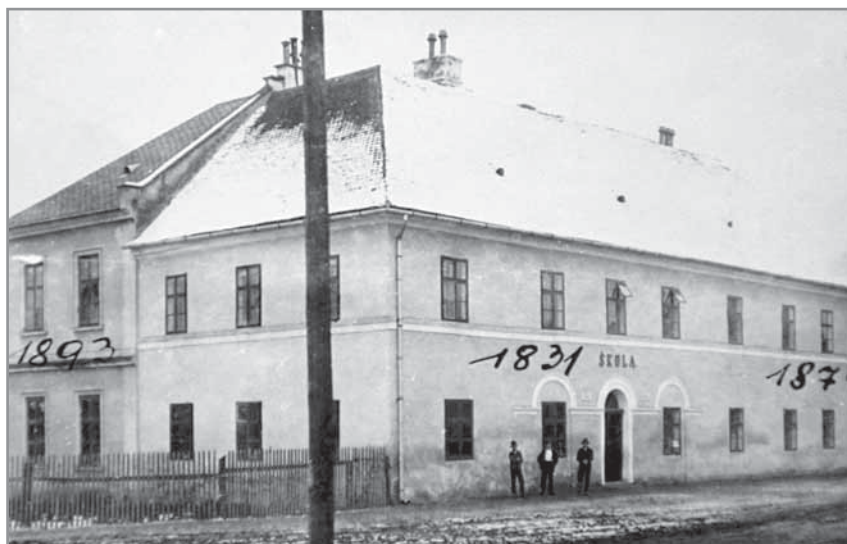
Obr. 24. Budova hlucké školy po přestavbě.

potřebám narůstajícího počtu dětí. Zatímco v roce 1875 bylo v Hluku 390 školou povinných dětí, v roce 1886 to již bylo 530 a roku 1905 na 609 žáků. A tak se budova neustále přestavovala a rozšiřovala. V letech 1892–1893 došlo k druhé přístavbě a v roce 1902 k třetí směrem k zámecké zahradě. Ve školním roce 1913–1914 měla hlucká obecná škola celkem 14 tříd v 11 učebnách, při čemž musely ještě směnovat děti prvních a druhých tříd. Učitelský sbor se rozrostl téměř na 20 členů.