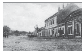
Obr. 3. Pohled na část hluckého náměstí.