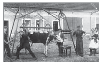
Obr. 9. Zvedací zařízení na dobytek.

V živočišné výrobě skončila doba společné pastvy dobytka na úhorech. Hospodářský a technický vývoj v druhé polovině 19. století