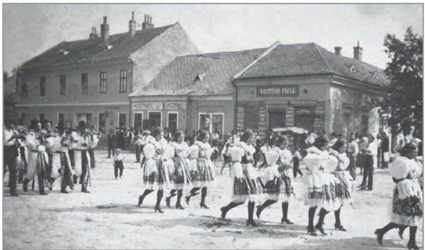
Obr. 7. Hlucké náměstí na přelomu druhého a třetího desetiletí 20. století.

Dílec a v roce 1900 také některá pole v Lůžkách. V roce 1910 pak vzniklo v Hluku vodní družstvo, které začalo s plánovitým odvodňováním za dozoru odborníků a se státní a zemskou subvencí. Stejně tak usilovala obec o regulaci Okluky, protože často rozvodněný potok působil značné škody v obci i na polích. První byla regulována část u mostu za Klebetovem v letech 1911–1912, další krátce po 1. světové válce.