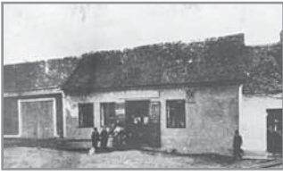
Obr. 12. Nejstarší hlucký obchod.

školy živnostenské. Učni tuto školu navštěvovali v neděli, v roce 1906 bylo ujednáno, že budou chodit do školy vždy ve středu odpoledne a že vyučování bude přítomen jako dozorce člen obecního výboru za odměnu 50 haléřů. Počty řemeslníků a obchodníků ukazuje následující přehled.