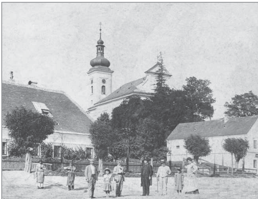
Obr. 1. Hlucké náměstí s lichtenštejnským dvorem a kostelem sv. Vavřínce.

Z rušení nevolnictví v roce 1781, kdy bylo poddaným dovoleno bez povolení vrchnosti vstupovat do manželského stavu, stěhovat se, učit se řemeslům a dána jim svoboda volného pohybu ve státě, vytvářelo lepší podmínky na trhu pracovních sil v nastupující průmyslové výrobě. Avšak rolník na venkově stále nemohl opustit zděděný grunt a pro jeho zachování byl nucen stále chodit robotovat a ještě část těžce získaného výtěžku odvádět vrchnosti nebo jako farský desátek. Proto se rolníci nadále bouřili proti robotám a své vrchnosti a usilovali o úplné osvobození z feudální závislosti. Také v Hluku sedláci několikrát odmítli nastoupit na robotu a bouřili se proti vrchnostenskému útlaku. Rychtář Hala byl například v roce 1830 odvolán ze své funkce, protože poddané podporoval v od-