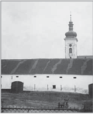
Obr. 2. Část vrchnostenského dvora v Hluku.

poru proti vrchnosti. Konečné osvobození poddaných však již dlouho na sebe nedalo čekat.