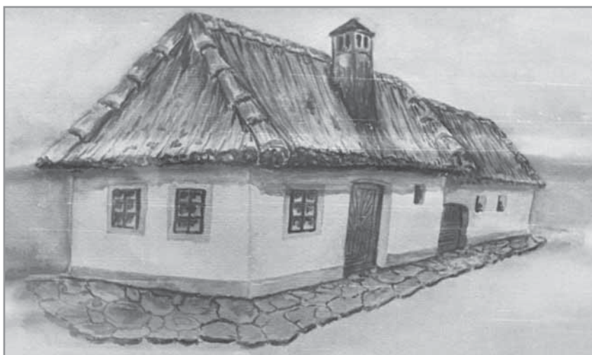
Obr. 22. Nejstarší škola v Hluku měla mít sídlo v č. p. 48 v nízkém doškovém stavení, vyobrazení má zachycovat stav k roku 1781.

Počátky novodobého školství byly položeny až za vlády císařovny Marie Terezie školskou reformou z roku 1774. V každé farní obci byla tehdy založena triviální škola, kde se kromě náboženství, které bylo hlavním předmětem, vyučovalo čtení, psaní a počty – trivium. Roku