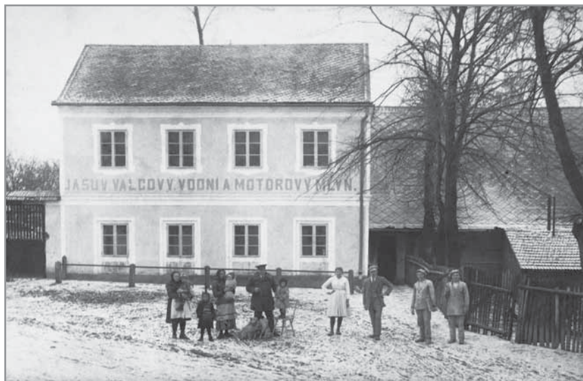
Obr. 14. Horní mlýn před přístavbou.