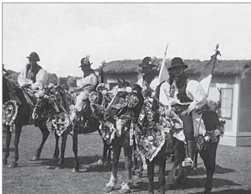
Obr. 1. Jezdci na koních v Hluku, 1926.

G eneze jízdy králů, původně letnicového zvyku spojeného s křesťanskými svatodušními svátky, není příliš jasná. V tomto období se v Čechách, na Moravě a ve Slezsku (ale i na Slovensku) konaly průvody královniček či obchůzky a objížděly králů a jejich družin s různými názvy (jízda králů, jezdit po králoch, hra na krále, honit krále aj.). 1 Ze srovnání materiálu v evropském prostředí vyplývá, že šlo zřejmě o rozsáhlejší systém magických předkřesťanských obyčejů, jež souvisely s odchodem zimy a počátkem nového vegetačního období. Mnohé motivy s původně magickým podtextem (volba a vybírání krále, projevy zdatnosti, výzdoba zelení a květinami apod.) se dají vystopovat i v dochovaných obyčejích na našem území. 2