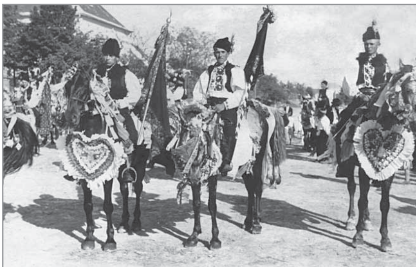
Obr. 6. Jízda králů. Třicátá léta 20. století.