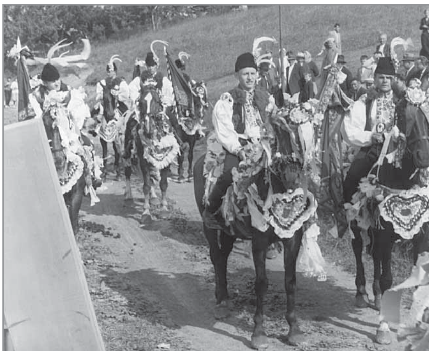
Obr. 7. Jízda králů, 2. června 1963.

stupně se jejich forma zafixovala tak, že se už příliš neměnily a jejich obecná podoba jim dovoluje je stále používat (například Před tímto domem je rovina, že tu bývá spořádaná rodina ). 20 Vyvolávky v jízdě králů patří k živé tradici tohoto obyčeje, kde se projevuje osobnost nositele, jeho tvůrčí možnosti včetně schopnosti improvizace a vtípu. Vedle tradičních promluv se zde objevují zároveň reakce na aktuální