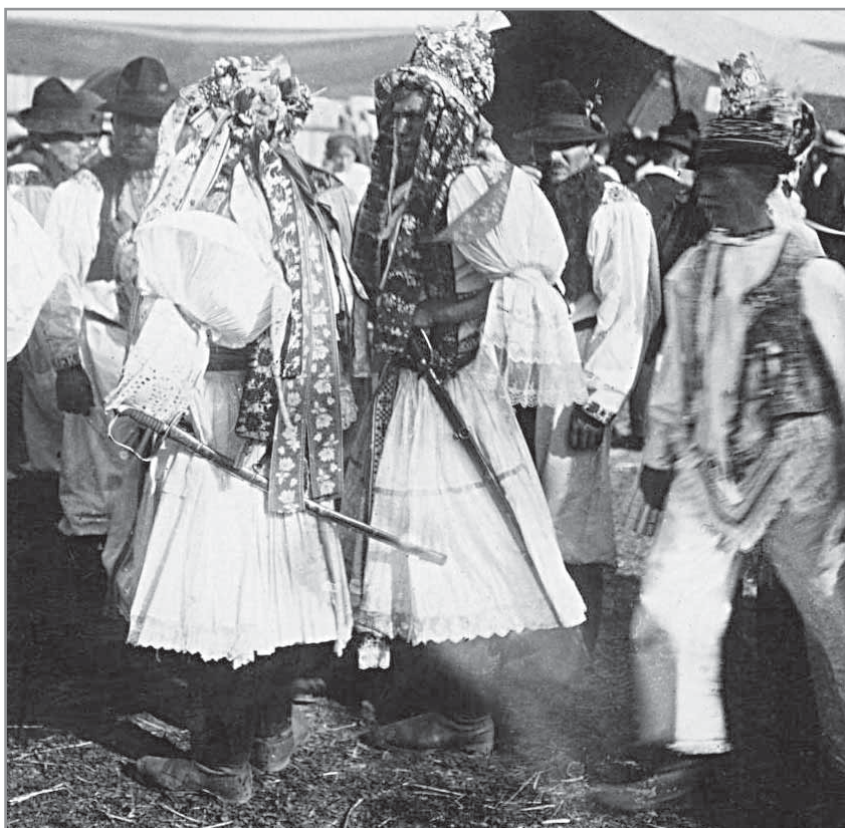
Obr. 2. Pobočníci z jízdy králů v Hluku, 1928. Ze sbírek Slovákckého muzea v Uherském Hradišti.

V lidových výkladech, které se soustředily na genezi jízdy králů, se objevují reminiscence na nejrůznější domnělé i skutečné místní historické události, jež získaly trvalé místo v orální tradici, jak dokazují výzkumy u pamětníků v minulosti i v současnosti. V ústní tradici se objevuje motiv pozůstatku vybírání daní, 5 či útěk uherského krále v ženském přestrojení, 6 ke kterému se vztahuje například i zápis pořizovaný v Hluku v roce 1967: „ Král sa mosí dycky převléct. Byl dycky v ženských šatoch. Král sa chtěl dostat přes hranice nebo kde, a aby sa tam dostál a nepoznali ho, tož sa převlékl do ženských šatů. Aby ho nezebrali. Král a ti jeho dvá pobočníci, to byli dycky tři menší chlapci. “ 7 U většiny tradičních obyčejů lze předpokládat vícevrstevnatost jejich vývoje, což platí i pro jízdu králů. Nemůžeme sice zcela vyloučit některé hypotézy, s určitostí však můžeme pracovat pouze se zmínkami a s doklady, které v případě Hluku nepřesahují hranici sto padesáti let.