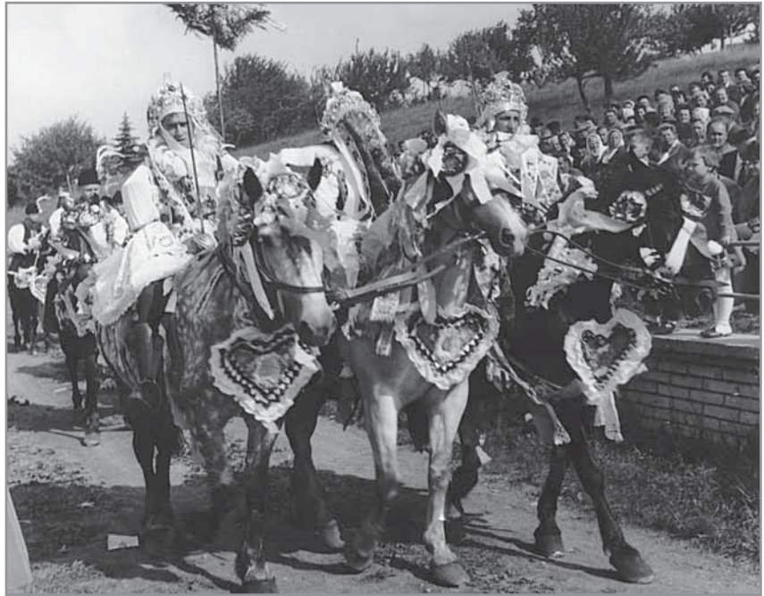
Obr. 8. Jízda králů, příjezd na stadion, 2. června 1963.